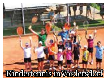
Kindertennis in Vordersdorf