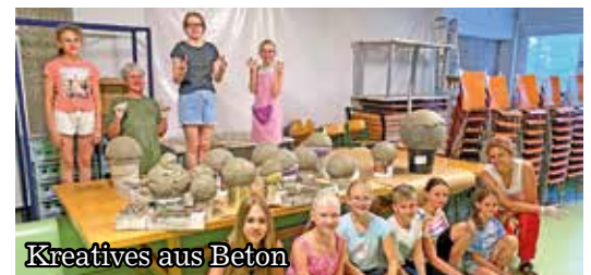
Kreatives aus Beton