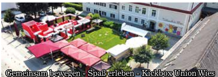
Gemeinsam bewegen - Spaß erleben - Kickbox Union Wies