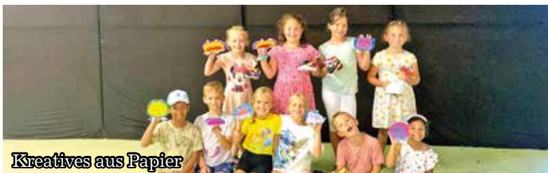
Kreatives aus Papier