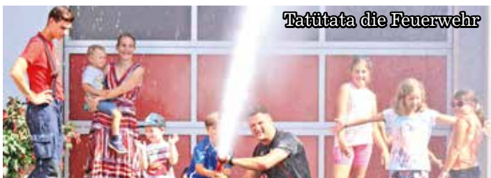
Tatütata die Feuerwehr