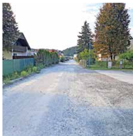
Altenmarkt - Sulmstraße

Kraßerstraße) wird Ende September begonnen. Und auch der sogenannte Caritasweg kann noch in diesem Jahr begonnen werden. Kürzlich wurde für diese Geh- und Radwegverbindung (Bahnhof Wies-Markt bis zum Caritaswohnheim) ein entsprechender Förderantrag beim Bund eingereicht, wodurch eine Auftragsvergabe nun möglich ist. Jedenfalls kann noch in diesem Jahr der Unterbau fertiggestellt werden. Die Asphaltierungsarbeiten erfolgen im Frühjahr 2025.