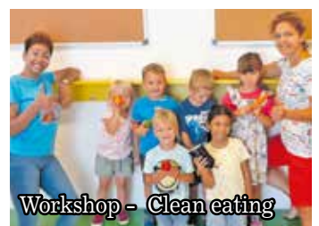
Workshop - Clean eating